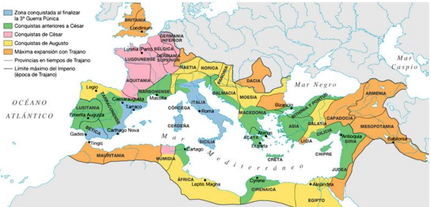
Ilustración 2. Mapa del Imperio Romano.

Hacia el año 395, con la muerte del emperador Teodosio I el grande, el imperio se divide en dos partes una para cada hijo, Arcadio y Honorio. El imperio romano de occidente, que continúa teniendo su capital en la ciudad de Roma, con Honorio como emperador, y la parte oriental del imperio con capital en Constantinopla, antigua Bizancio, comenzó a llamarse Imperio Romano de Oriente o Imperio Bizantino, con Arcadio como emperador. Más adelante, hacia el siglo IV, el Imperio Romano, el occidental, entra en crisis profunda debido a varios factores: