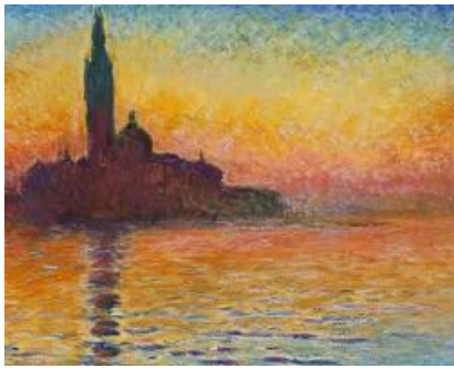
Claude Monet paintings

El Impresionismo tuvo un impacto profundo en el arte moderno. Ayudó a abrir el camino a otros movimientos artísticos, como el postimpresionismo y el fauvismo. Los artistas impresionistas siguen siendo admirados por su capacidad para capturar la belleza y la atmósfera de un momento fugaz.