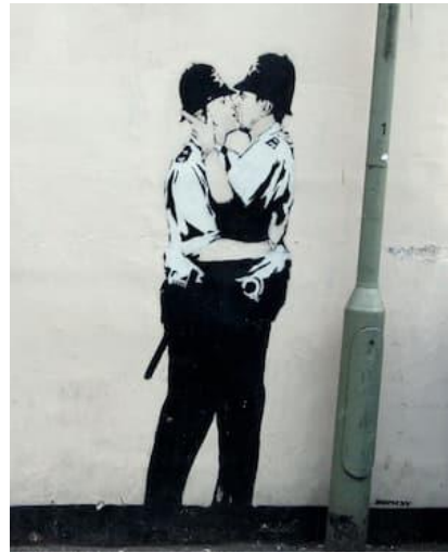
Kissing coopers, 2004