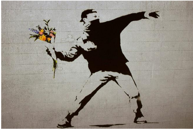
Love is in the air, 2003

8. Define origen y características del arte urbano. Analiza las obras Kissing coopers, 2004 y Love is in the air, 2003 del graffitero Banksy.