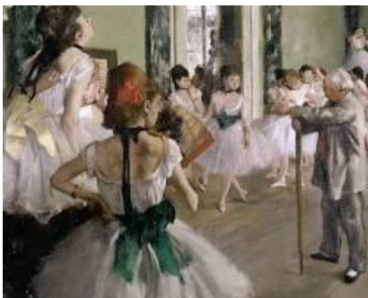
Edgar Degas paintings