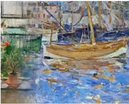
Camille Pissarro paintings