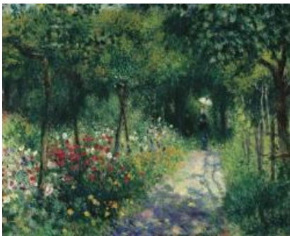
PierreAuguste Renoir paintings