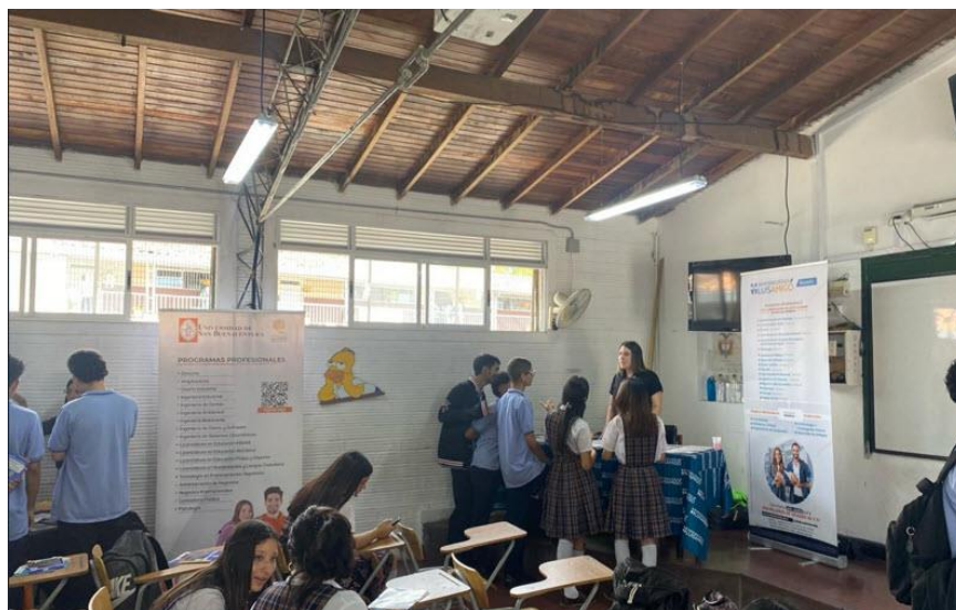
Abril 17 de 2024: Visita a la Universidad de Antioquía: