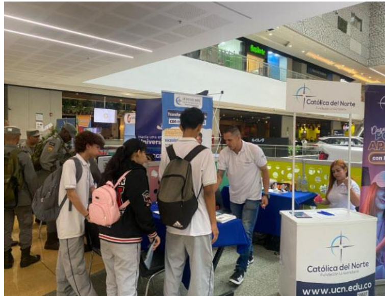
Junio 04 de 2024: Salida Universidad Nacional