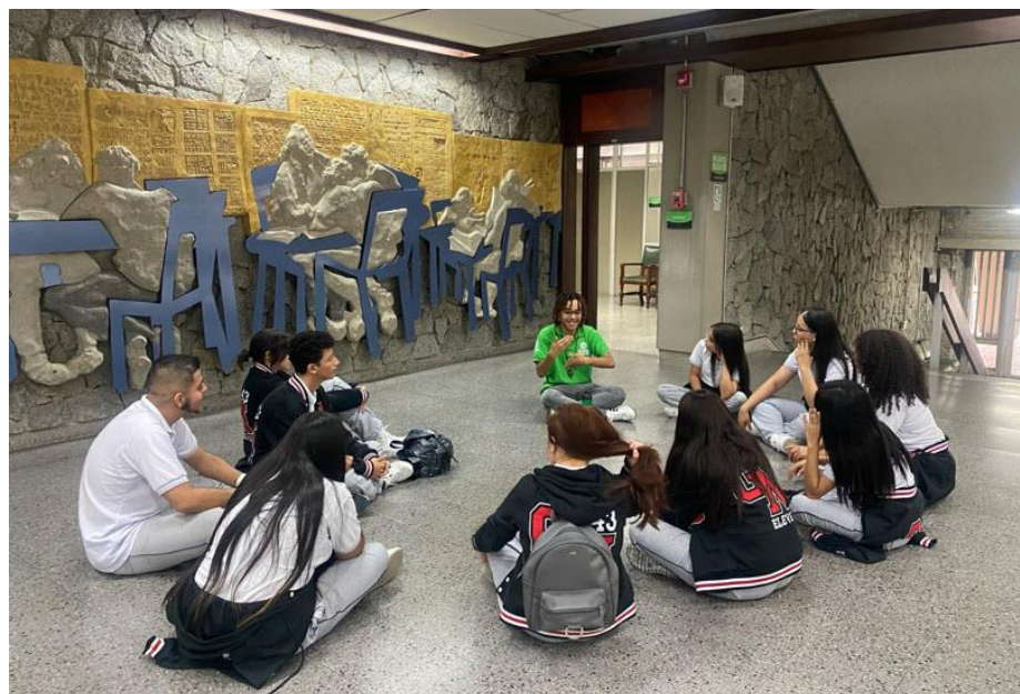
Abril 19 de 2024: 16ª. Feria de Universidades y Otros Estudios CAMPUS U 2024