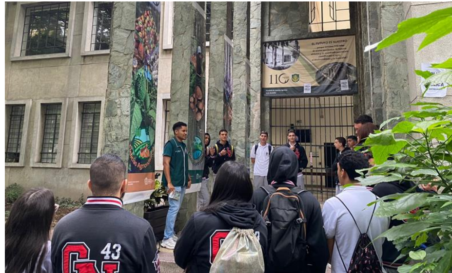
Julo 25 de 2024: Vista de media técnica al Politécnico Jaime Isaza Cadavid