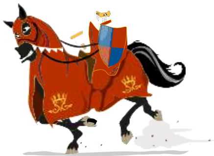
El príncipe negro

Lee la siguiente información y conoce un poco sobre los caballeros de la edad media.