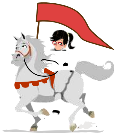
Juana de Arco