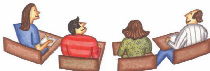
Imagen guía 26 del Ministerio de Educación Nacional.