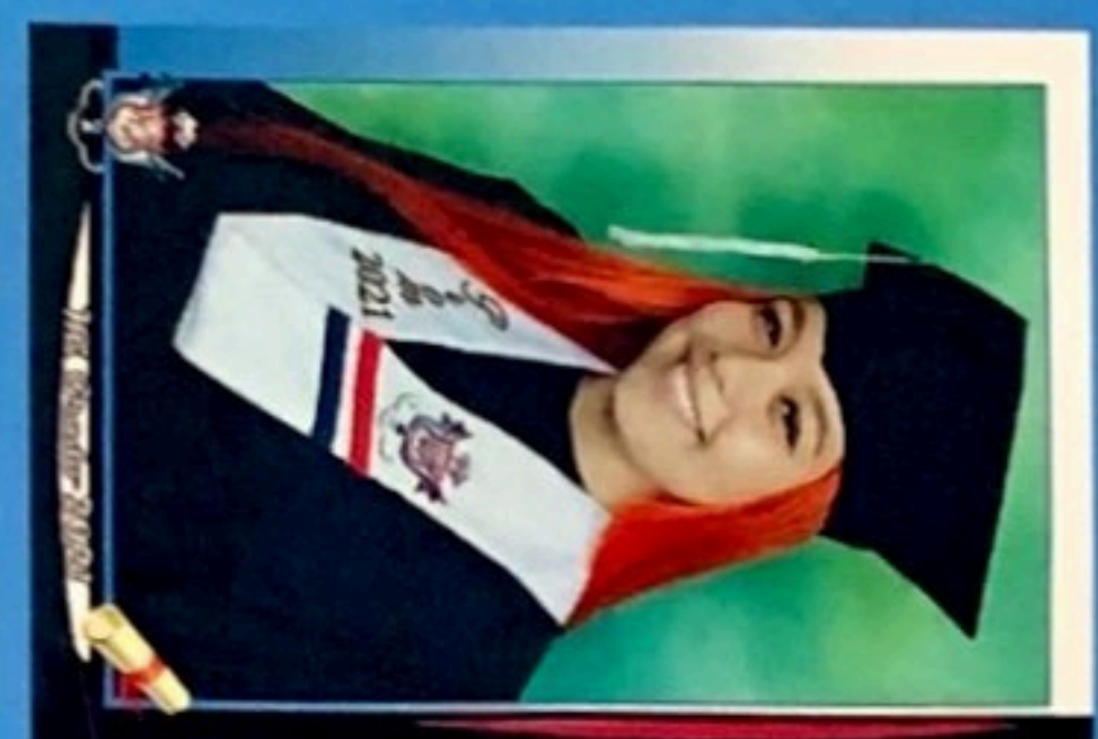
FOTO AFICHE de 33x48 Cm.

EL COSTO DE ESTA PROPUESTA ES DE $100.000.000.