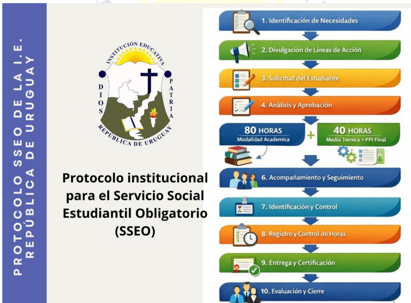
Figura 1 Protocolo institucional para el Servicio Social Estudiantil Obligatorio (SSEO)

Finalmente, el proyecto de Servicio Social Estudiantil Obligatorio será evaluado de manera institucional por el líder docente, estudiantes, padres de familia, docentes, consejo académico, directivos docentes y supervisores, con el propósito de analizar su impacto y generar insumos para el mejoramiento y ajuste del proyecto en el siguiente año lectivo.