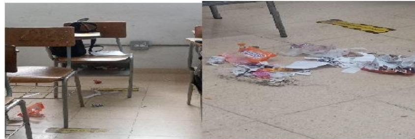
No queremos encontrar un salón sucio...