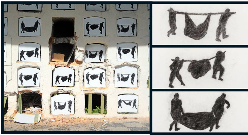
auroras anónimas, serigrafía. 2007 - 2009

Doris Salcedo: quien utiliza símbolos de dolor y memoria para abordar el conflicto armado en Colombia.