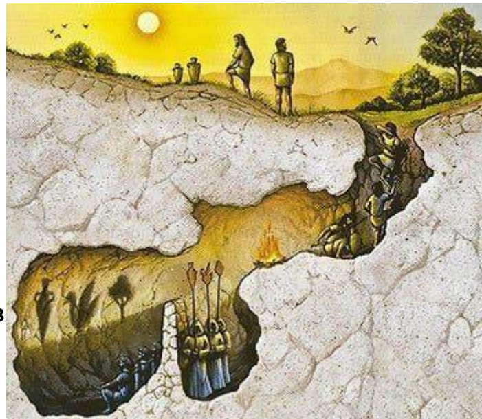
Ficha de Trabajo #3