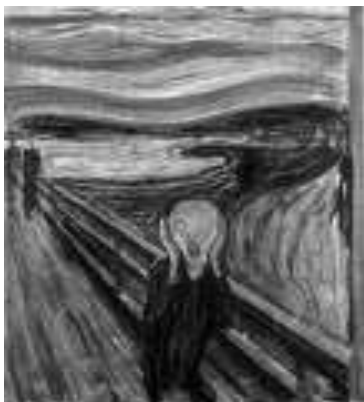
El grito (Edvard Munch)

Como pintor, Edvard Munch intentó abarcar todas las facetas de la vida. Pero aquello que lo convirtió en uno de los más importantes exponentes del arte moderno fue su capacidad para expresar, a través del color y el tratamiento esquemático de las figuras, toda la fuerza y profundidad del dolor del hombre. Observa cómo en El grito, su obra más conocida, por medio de un personaje asexual y carente de rasgos particulares, Munch consigue enfrentarnos a nuestro propio dolor, y logra exponer la universalidad del sufrimiento humano. Aquí, la naturaleza no es confortante. Por el contrario, la tensión que en ella se manifiesta ayuda a ahondar el sentimiento del personaje. En lugar de aplacar la intensidad del grito, lo arrastra más allá de los límites de la existencia.