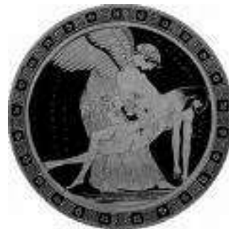
Plato decorado de la Grecia clásica

La mitología griega consiste en parte en una extensa colección de relatos que explica los orígenes del mundo y detalla las vidas y aventuras de una amplia variedad de dioses, héroes y otras