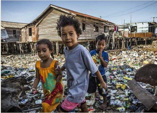
Niños jugando en un vertedero del poblado de Hanuabada, Port Moresby (Papúa Nueva Guinea), donde las casas no tienen agua corriente ni aseos adecuados, 30 de mayo de 2013.