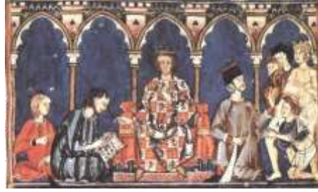
Imagen de Alfonso X, el sabio