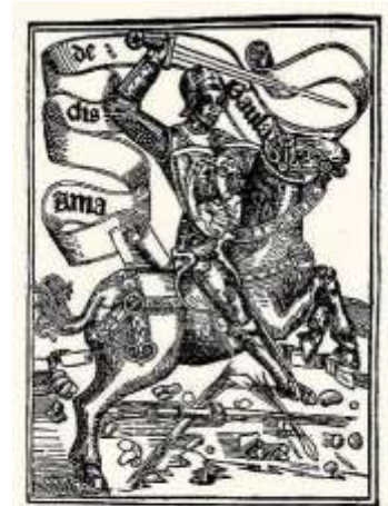
Los quatro libros del glorioso cauallero Amadís de Gaula: Complidos.

Soy Amadís de Gaula y sé que tomarais en consideración el entregarme vuestra confianza.