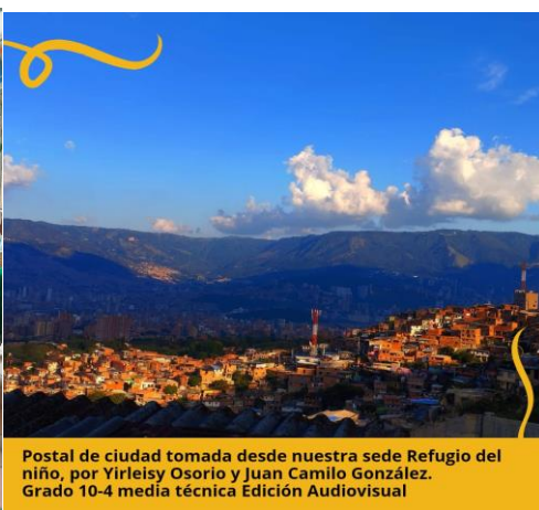
Postal de ciudad tomada desde nuestra sede Refugio del niño, por Yirleisy Osorio y Juan Camilo González. Grado 10-4 media técnica Edición Audiovisual