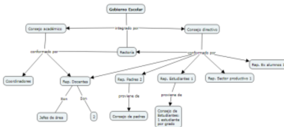
Figura 1. Órganos y conformación del gobierno escolar.

El gobierno escolar de la Institución Educativa Fe y Alegría San José está conformado como lo indica la siguiente figura: