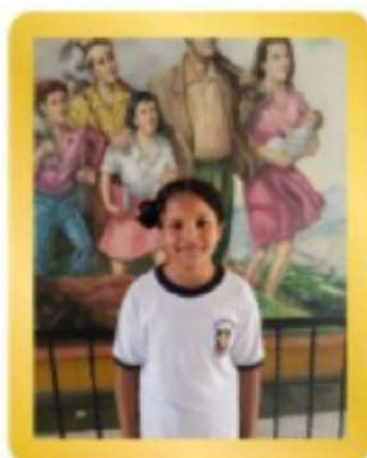
Scarlig Sumoza Sana Convivencia y Valores Franciscanos