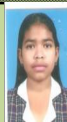
CALLE SOLANO ALBANYS ANDREA 1003