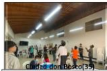
Ciudad don Bosco(39) Reconocer y creer en la capacidad de los pares para sostenernos y crecer juntos, condición que nos permite ser más humanos