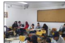
Boston-SISTEMA DE RESPONSABILIDAD PENA PARA ADOLESCENTES(60) Infringir la norma, pero asumir el reto de restituir el daño y avanzar es la tarea permanente.