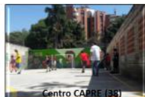
Centro CAPRE (38) El disfrute del otro y lo otro como opción de vida después de desvincularse del conflicto armado forzoso