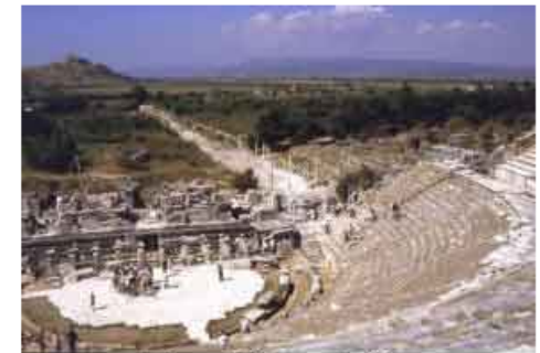
Ruinas del Teatro de Éfeso

Escribió una obra a la que se le da el título común " Sobre la naturaleza" que se le había dado también a los libros escritos por otros filósofos anteriores. No es seguro que se tratara realmente de un libro en el que se desarrollaran sistemáticamente temas relacionados con el conocimiento de la naturaleza, el alma o la cosmología. Es probable que se tratara de un conjunto de sentencias recopiladas en forma de libro, hipótesis que se apoya en el carácter enigmático y oracular de los fragmentos que conservamos, carácter que ya en su época le valió el sobrenombre de "El oscuro".