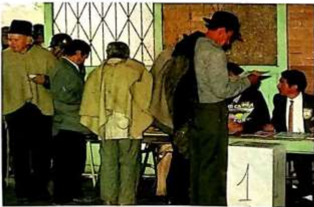
■ Colombia es una república democrática presidencialista, debido a que el poder ejecutivo tiene predominio sobre las principales decisiones del Estado y el gobierno.

sos tipos de repúblicas democráticas, según sea el predominio que tenga una rama del poder sobre las otras. Así, cuando tiene predominio del ejecutivo, se habla de democracia presidencialista; si el predominio es de la rama legislativa, se habla de democracia parlamentaria. En los casos en que la república se haya organizado a partir de una revolución social, se habla de república popular o socialista.