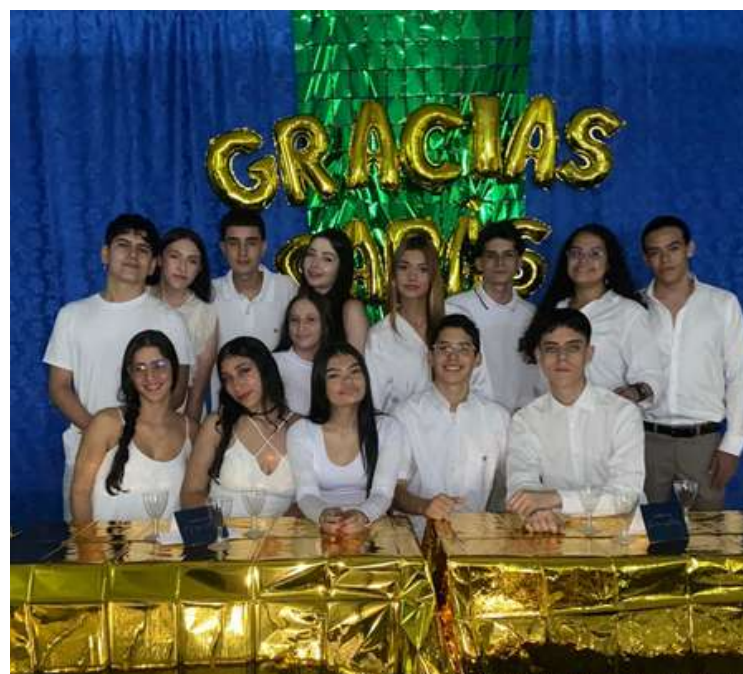
Nos despedimos de la novena generación de grado 11°