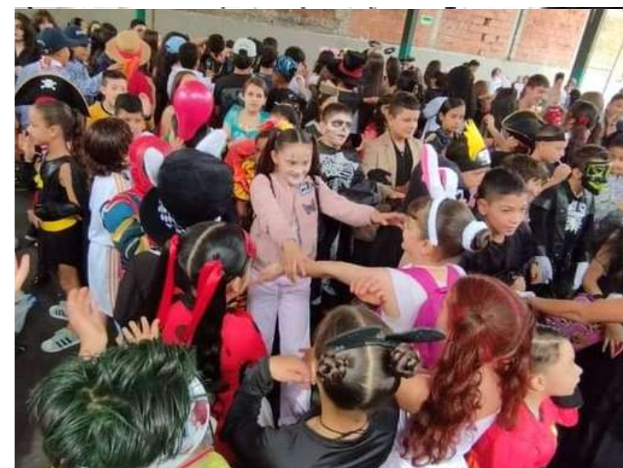
Vivimos las últimas actividades culturales del año en la institución