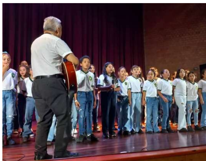
Demostamos los talentos de todo tipo que se cultivaron a lo largo del año

Cerramos este maravilloso 2023 lleno de experiencias únicas y personas que siempre llevaremos en nuestros corazones.